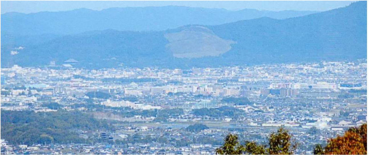
「昨年明神山に設置された悠久の鐘」