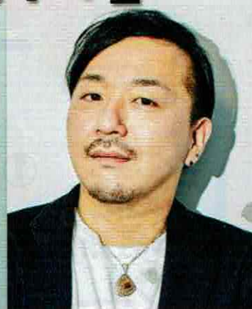
1984年京都府生まれ。100万部を突破した著書「じんかん」で直木賞候補となった今注目の若手歴史・時代小説作家。